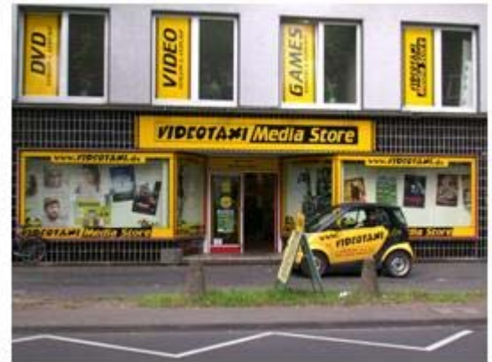
Beispiel Leverkusen: Automat am Konrad-Adenauer-Platz (sonntags geöffnet) und 300 Meter weiter Videothek in der Hardenbergstraße (sonntags geschlossen).