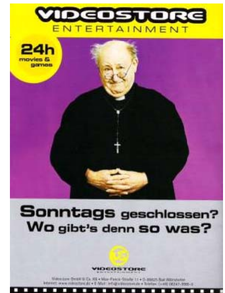
Anzeige eines Automatenherstellers in der Fachzeitschrift Videowoche

Die Automatenbetreiber nutzten den Wettbewerbsvorteil am Sonntag und investierten vorrangig in Bundesländern, die keine Sonntagsöffnung der Videotheken erlauben. Dabei öffneten Sie insbesondere in Bayern sehr häufig in direkter Nähe zu herkömmlichen Videotheken.